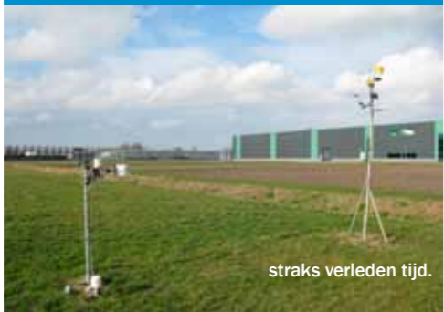
straks verleden tijd.

Dit groeiseizoen gaan Agrovision en Dacom proefdraaien met een omrekenformule die de informatie van hun weerpalen uitwisselbaar maakt. Dacom meet volgens de internationale standaard op 150 cm hoogte, terwijl Agrovision gebruik maakt van sensoren in het gewas. Omdat lokale metingen belangrijk zijn voor een goed spuitadvies, is er met hulp van het Masterplan Phytophthora een omrekenfactor ontwikkeld. Hierdoor moet een dichter netwerk van meetgegevens ontstaan en zijn situaties zoals op bijgaande foto straks verleden tijd.